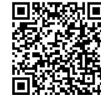
新田圍堂直播及重播 QR Code 二維條碼