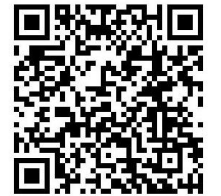
新田圍堂重播 QR 二維條碼