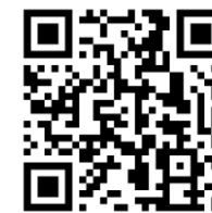
總堂直播及重播 QR 二維條碼

總堂直播網址: www.facebook.com/hknewlifechurch/ 新田圍堂重播網址: www.facebook.com/新田圍堂-STW-100443158229896/